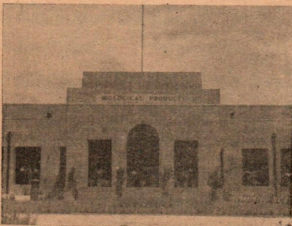
ตึก Biological Products Indian Veterinary Institute, Izatnagar

เมื่อรู้กำหนดการเดินทางแน่นอนแล้ว บ่ายวันนั้นจึงได้ออกไป shopping หาของจำเป็นใช้ ซึ่งส่วนมากเกี่ยวข้องกับเครื่องหนาว เราสนใจพอใจว่าเป็น ทนความหนาวได้แน่ มี Overcoat, underwear, ถุงมือ และ หมวกขนสัตว์ ของจำเป็นอีกอย่างคือเครื่องนอน ผู้ที่เดินทางในประเทศอินเดีย จำเป็นอย่างยิ่งที่จะต้อง มี เครื่องนอน ติดตัวไปด้วย