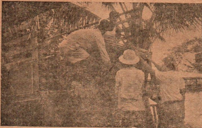
การลำเลียงสุกรจากเล้าไปสู่ท่าขนส่งทางอากาศ

ในขณะที่มีสัตว์ภาวะทั่วไปของกิจการเกี่ยวกับสุกรของประเทศ ก่าดังซบเซาเนื่องมาจาก จากสภาวะการทางตลาดเป็นส่วนใหญ่ สุกรพันธุ์ ที่ผลิตขึ้นในประเทศโดยฝีมือของศูนย์บำรุง พันธุ์ สุกรในอุปการะของรัฐบาล และแผนกสัตว์เด็กรกรมปศุสัตว์ ได้พิศุจน์ความดีให้ประเทศ เพื่อนบ้านได้ประจักษ์ จนได้รับความไว้วางใจให้เป็นตัวช่วยในการปฏิวัติคุณภาพสุกรพ บ้านของประเทศพม่าให้มีคุณภาพสูงเหมาะแก่การบริโภคยิ่งขึ้น นับว่าจะเป็นก้าวสำคัญที่ สร้างเสริมให้ประชากรพม่าได้มีการอยู่อาศัยที่ดี เพื่อสร้างเสริมความมั่นคงทางเศรษฐกิจแห่ง ชาติพม่า ซึ่งมรดกไทยทั้งปวงควรจะยินดีเป็นอย่างยิ่ง