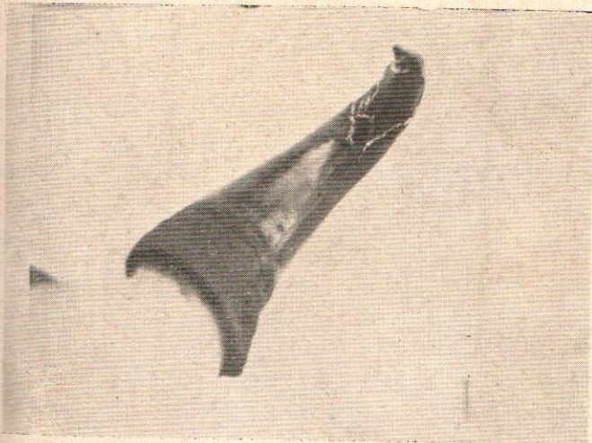
เขาวัวแดงแก่ Horn of aged Banting