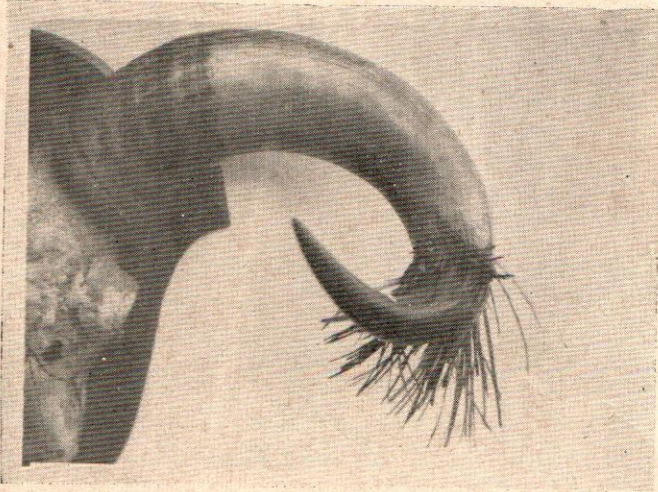
เขากูปรีแก่ Horn of aged Kouprey