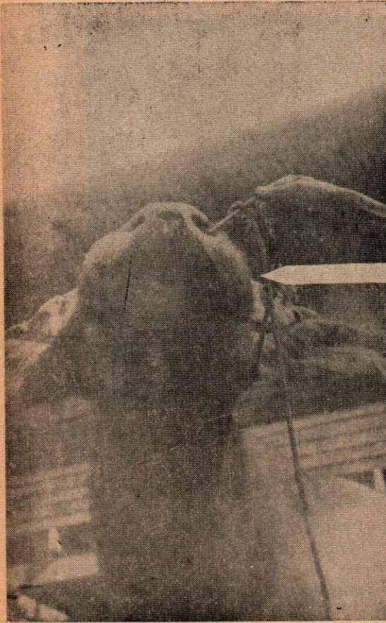
อาการบวมที่ muzzle