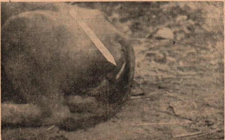
ลักษณะ vulva บวม ในกระบือเมีย

ระยะต่อมาของการระบาดจะพบกระบือป่วยยืนซึ่มไม่บดเอื้อง จมูกแห้ง หัวต่ำลง หูดก หางจุกตุต หายใจแรง ต่อจากนั้นจะมีน้ำลายเป็นฟองที่ปาก มีไอบ้างเล็กน้อย ปากจะอำเป็นครั้งคราวและแลบลิ้นออกมา หลังจาก ๑๒ ชั่วโมงผ่านไปปากจะอำตลอดมีลิ้นห้อยออกมา น้ำลายไหล หายใจดังมาก จะตายภายใน ๑๒—๒๔ ชั่วโมง ชนิดนี้เรียกว่า Pectoral form ชนิดนี้เราชาวสัตวแพทย์ต่างจังหวัดพบมาก สิ่งที่จะทำให้สัตวแพทย์เรารู้สึกสับสนเพราะชนิดบวมน้ำ (Edematous form) คือพอเราพบกระบือป่วยจะสังเกตเห็นอาการ ดังนี้ จมูกแห้ง ยืนซึ่ม หัวตก หายใจปกติ แต่มีอาการที่ผิดออกไปคือ กระบือเมียจะมีอวัยวะเพศบวมที่ Vulva (ดังรูป) ในตัวผู้หนังหุ้มลิ้นคัม (prepuce) (ดังรูป) อาการ